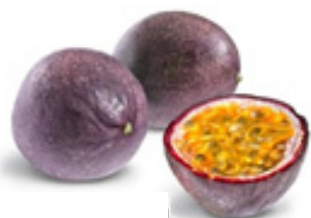
Fruit de la passion