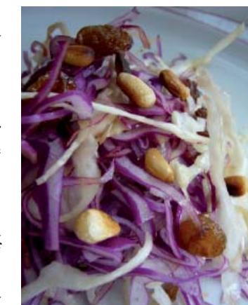
Fiche de Episode, Lingolsheim

Faire griller à sec les pignons dans une poêle à revêtement anti-adhésif (attention : ils brûlent rapidement). Les ajouter à la salade.