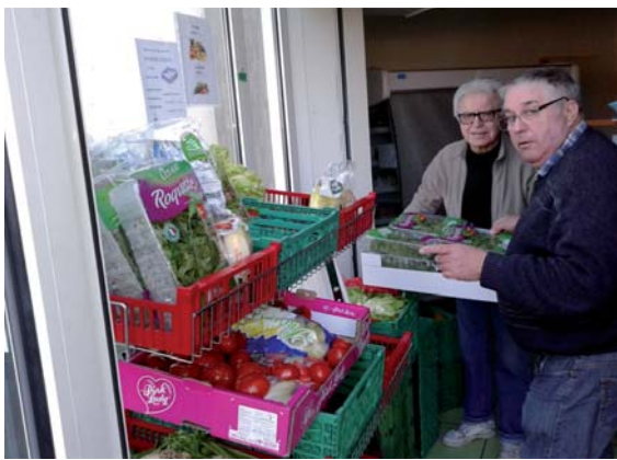
... on s'affaire à Geispolsheim ...

- La distribution de colis au Neuhof se poursuit avec les accompagnements habituels : vestiaire, aide financière, FLE, et le projet est de sortir du local de la rue des Jésuites, de construire un nouveau bâtiment permettant de mieux organiser les activités mais aussi de créer une Epicerie sociale avec ses objectifs de suivi et d'engagement des bénéficiaires, pour une meilleure efficacité de l'AA.